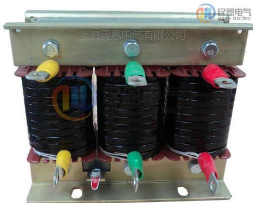
( 低压电容器专用串联电抗器 )